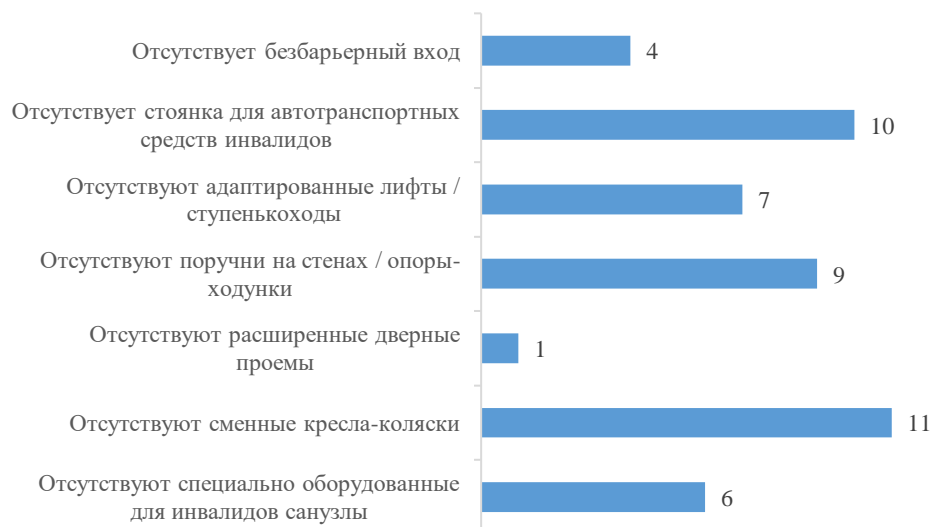
График 2. Отсутствие параметров оценки доступности помещений для инвалидов в образовательных организациях, количество образовательных организаций