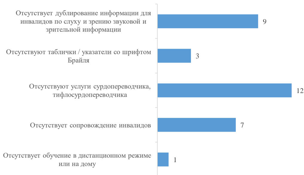
График 3. Отсутствие параметров оценки доступности образования для инвалидов в образовательных организациях, количество образовательных организации